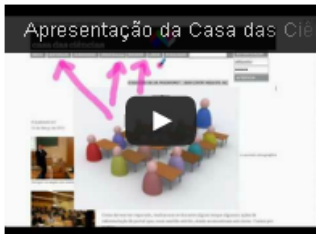
Apresentação do portal

Veja as fotos da Cerimónia de Entrega dos Prémios Casa das Ciências 2010, 2011 e 2012.