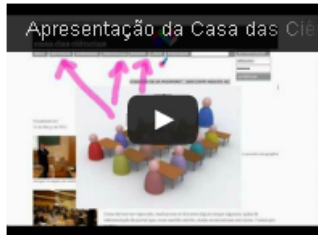
Apresentação do portal

Veja as fotos da Cerimónia de Entrega dos Prémios Casa das Ciências 2010, 2011 e 2012.